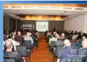
● ROSARIO 2010