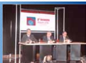
● ROSARIO 2005