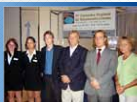
● TUCUMÁN 2004

Su última edición, realizada del 28 al 30 de junio del presente año, ha marcado un nuevo record de convocatoria; logrando presentar una exposición comercial con más de 50 firmas, 5 seminarios, 2 talleres y 3 workshops, ante casi 1.000 acreditados que se dieron cita en el Complejo City Center Rosario. Debido a este gran suceso, Encuentros Regionales 2012 Rosario será el 26, 27 y 28 de Junio ; y su empresa no puede estar ausente.