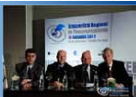
● ROSARIO 2011

Se realizaron ediciones de Encuentros Regionales en muchas partes de nuestro país: