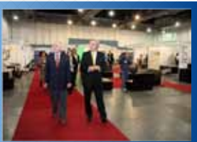
● ROSARIO 2009