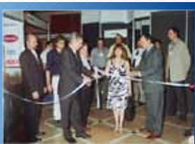
● CORRIENTES 2008