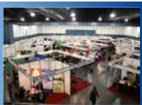
● ROSARIO 2008