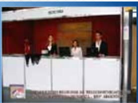
● MENDOZA 2007